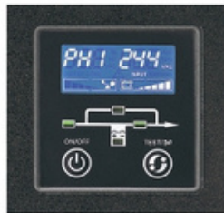
Display LCD con información clara del estatus y mediciones del UPS