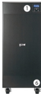
UPS Eaton 9E 6Ki